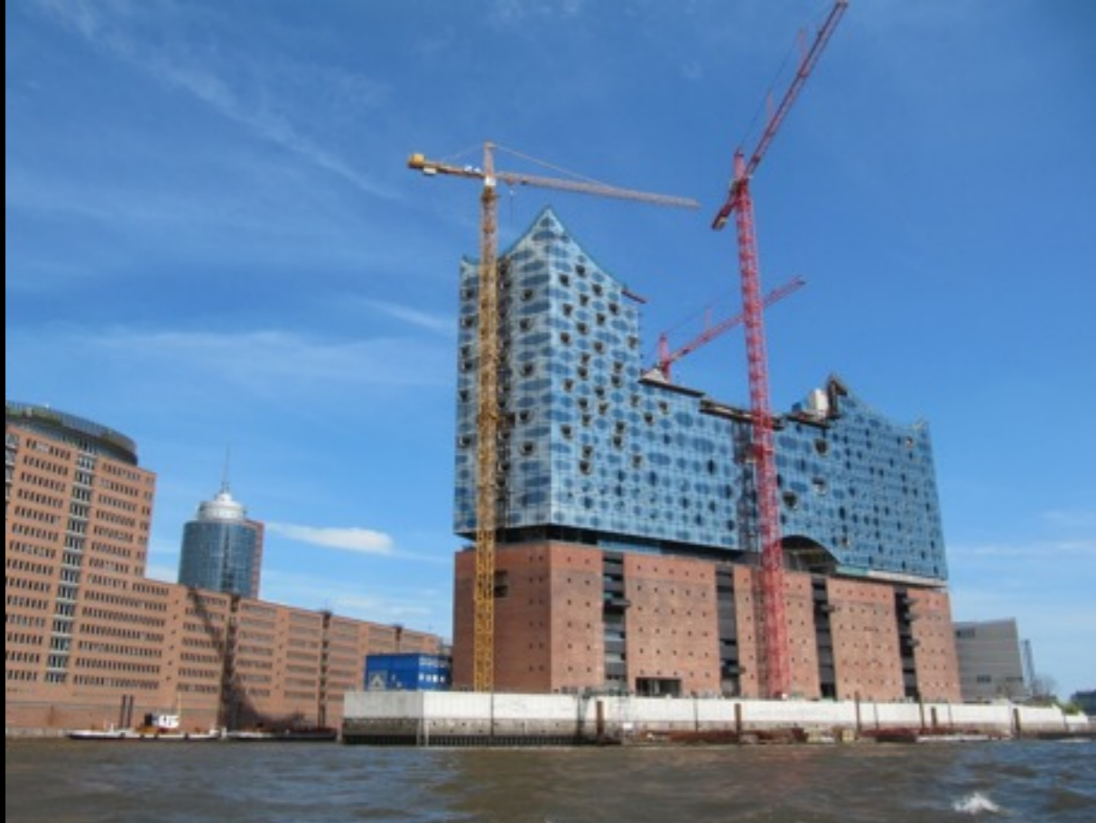
Hamburg — Elbphilharmonie — Herzog & de Meuron