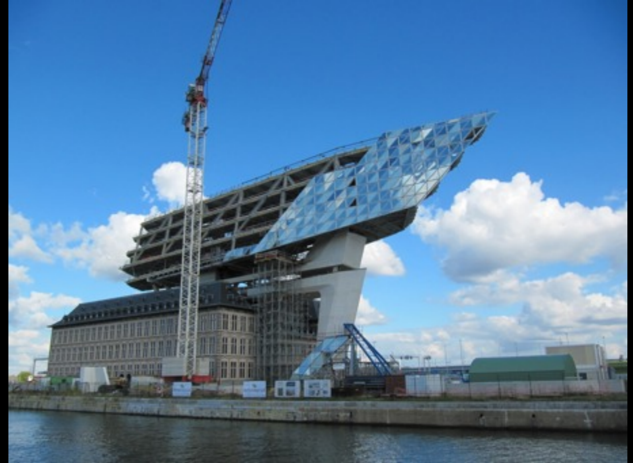
Antwerpen — Havenhuis — Zaha Hadid